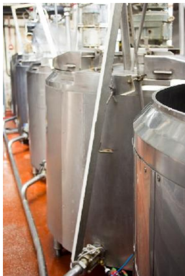
Keskipakovoima kattilat, lempinimeltään "Salaattilingot"