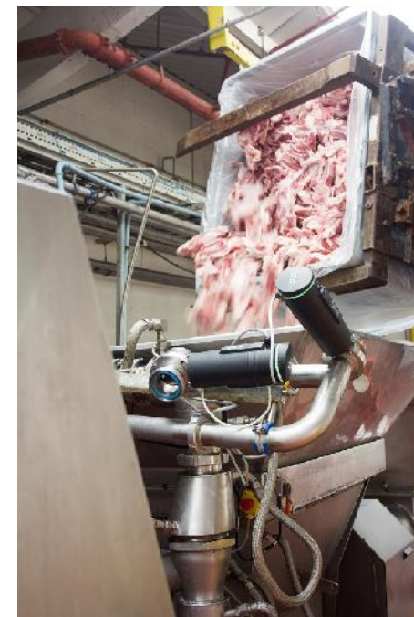
Tuore liha lisätään "Salaattilinkoon"