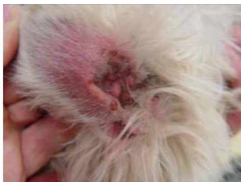
Malassezia pachydermatitis Westien korvassa http://www.whwtc.nl/huidproblemen_bestanden/image008.jpg

Yleisimmin hiivatulehduksen syynä ovat elimistössä yleisesti elävät hiivat. Malassezia pachydermatitis , jota normaalisti löytyy iholla ja korvissa sekä Candida albicans , joka on osa normaalin suoliston mikroflooraa.