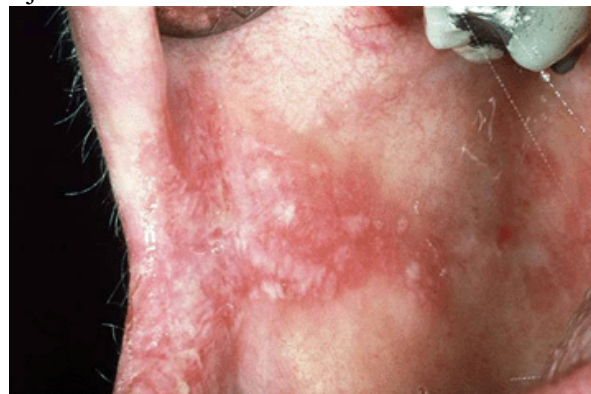
Candida Albican ylikasvua suussa www.whocollab.od.mah.se/expl/oralmuc.html

Jokainen koira (kuten ihminenkin) elää todellisuudessa mikro-organismien meressä (bakteerit, virukset, sienet yms.) Näitä mikro-organismeja on nielussa, suussa, nenässä, suolistossa, lähes joka paikassa; ne ovat eläviä osia kehoa. Erilaisia bakteereja on suolistossa satoja, samoin erityyppisiä hiivoja ja muita mikro-organismeja. Yleensä nämä mikro-organismit eivät aiheuta ongelmia, vaan ylläpitävät terveyttä yhteisössä tasapainoisesti keskenään. Ongelmia tulee, kun tämä tasapaino järkkyy. Järkyttäjänä voi olla pelkkä stressi, joskin yhä yleisemmin syynä antibioottikuuri ja sen vaikutukset vastustuskykyyn. Vastustuskyvyn soluista yli 70 % sijaitsevat suolistossa!