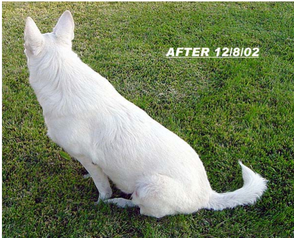
Hiivatulehdus ennen hoitoa ja hoidon jälkeen http://www.greatdanelady.com/articles/feed_program_for_systemic_yeast_problems.htm