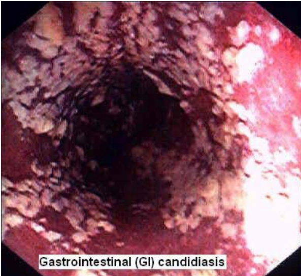
Gastrointestinal (GI) candidiasis

Candida Albicans ylikasvu suolessa http://george-ebby-research.com/gif/candida-gut.jpg